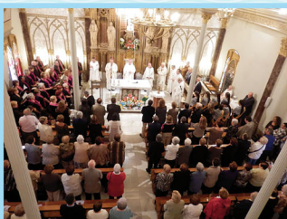
L'Oratori de la Verge Blanca de l'Acadèmia durant l'Eucaristia.