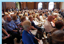
El Paranímf de l'Acadèmia Mariana durant el Certamen.