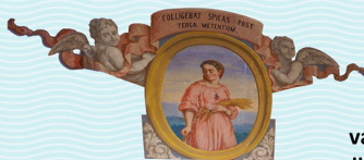
Oratori de la Verge Blanca de l'Acadèmia, timpà lateral esquerre (centre). Manuel Marqués i Carles (1870-71).

Ruth, moabita virtuosa de gran pietat que a l'enviudar anà amb la seva sogra Noemí a Betlem, on recollien espigues per poder viure. Allí es casà amb Obed, pare d'Isaí, qui ho va ser a la vegada de David, del llinatge del qual naixeria Jesús.