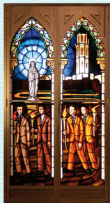
Oratori de la Verge Blanca de l'Acadèmia, 1969. Vitral inferior esquerre (a i b).

Rosari de torxes commemoratiu del centenari de l'Acadèmia Mariana el 1962. Des de la plaça Mossèn Cinto Verdager fins a la Seu Vella, amb la participació de més de 5.000 persones.