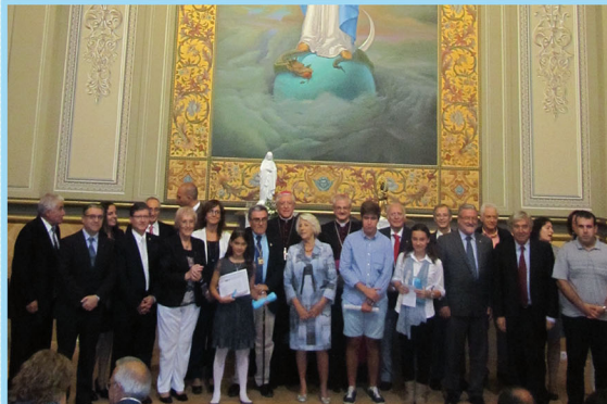
Els guardonats al Certamen amb les autoritats.