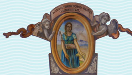
Oratori de la Verge Blanca de l'Acadèmia, timpà lateral dreta (capçalera). 3ª pintura de Jaume Morera i Galícia (1870-71).

Raquel, filla de Labán i esposa de Jacob, de qui van néixer Josep i Benjamí. El seu nom vol dir ovella. De gran bellesa, per poder casar-se amb ella Jacob va haver de treballar catorze anys pel seu oncle Labán. Va vestida de pastora.