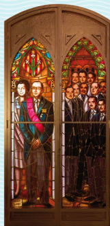
Oratori de la Verge Blanca de l'Acadèmia, 1969. Vitral inferior dreta (a i b).

Ja que Lleida us aclamava la Patrona del seu cor i amorosa es consagrava filial al vostre honor, deu-nos fruits al camp i feu-nos fills de Déu en llibertat: (Goigs a la Verge Blanca de l'Acadèmia, A. Fortuny 1996. Fragment)