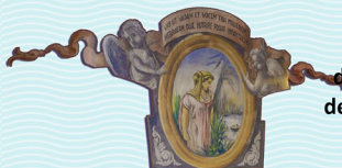
Oratori de la Verge Blanca de l'Acadèmia, timpà lateral dreta (centre). 2ª pintura de Jaume Morera i Galicia (1870-71).

Míriam, germana de Moisès, a qui va deixar al Nil, en un cistell de vímet per a salvar-lo. Va vestida d'hebreu; a l'entorn hi ha plantes del Nil (papirs, canyes i palmeres).