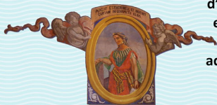
Oratori de la Verge Blanca de l'Acadèmia, timpà lateral esquerre (peus). Manuel Marqués i Carles (1870-71).

RECORDATUS QUOQUE DOMINI RACHELIS EXAUDIVIT EAM: "Déu es va recordar de Raquel, va escoltar-la." (Gn 30,22)